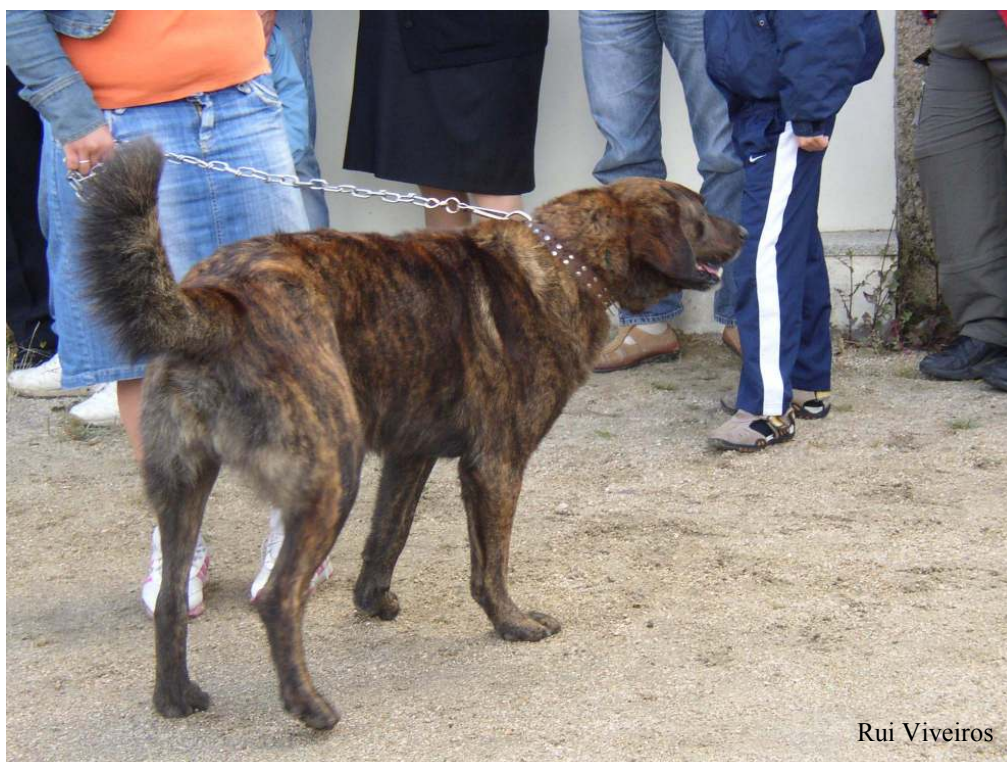
Cor do monte